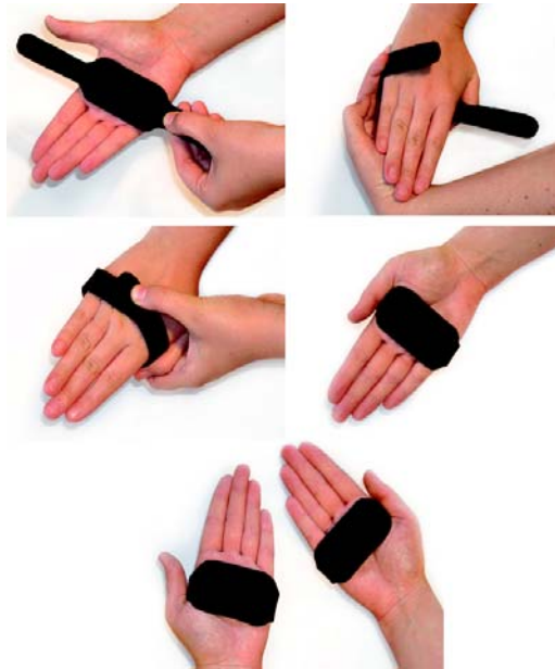
Figura 8: Etapas de colocação das luvas especiais reguláveis.