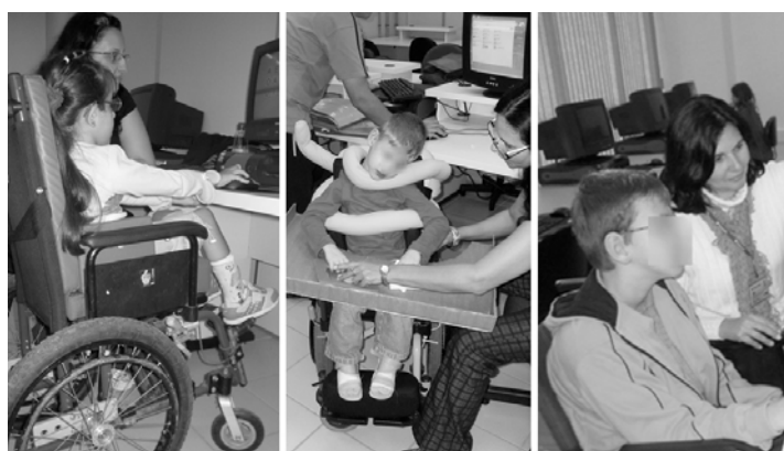
Figura 1: Crianças pacientes do Projeto de Pesquisa em Design Inclusivo da Feevale.

Especificamente, o artigo trata sobre a criação de um jogo educativo para crianças com Paralisia Cerebral, pacientes do Projeto de Pesquisa em Design Inclusivo da Universidade Feevale, em Novo Hamburgo/RS (Figura 1). O Projeto de Pesquisa em Design Inclusivo da Universidade Feevale tem a finalidade de estabelecer um estudo interdisciplinar que possibilite o desenvolvimento de pesquisa em design, de modo a contribuir para a melhora do atendimento de pessoas com deficiência, facilitando sua integração na sociedade através da utilização das TICs – Tecnologias de Informação e Comunicação.