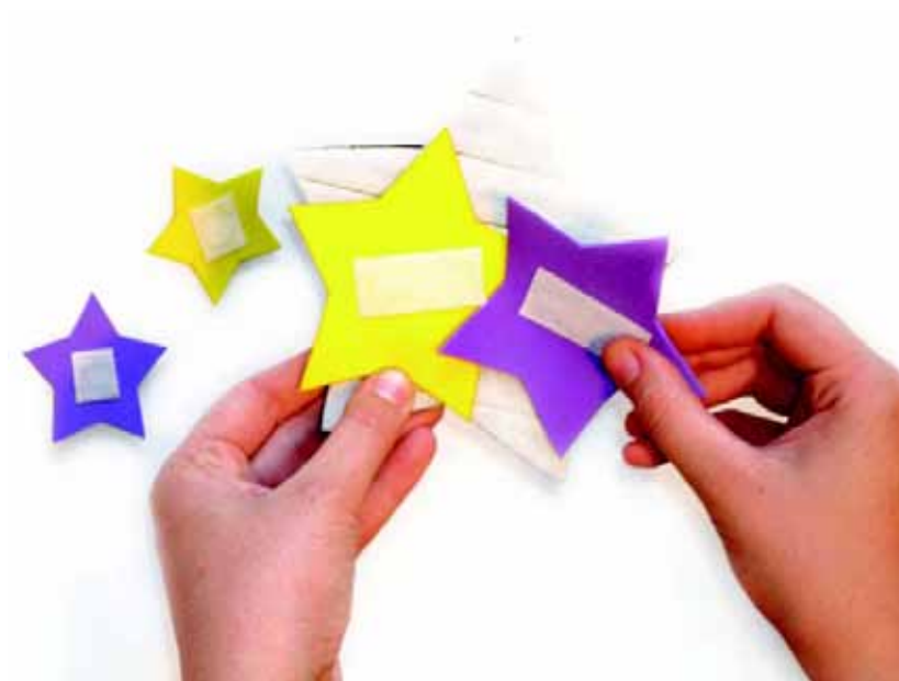
Figura 7: Peças na base.

As luvas especiais são de E.V.A. preto com aplicação de velcro, nas duas partes, permitindo com que sejam ajustadas de acordo com o tamanho da mão (Figura 8).