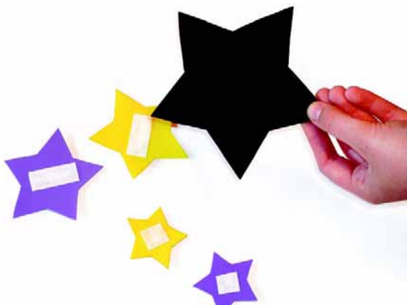
Figura 6: Verso da base com E.V.A.