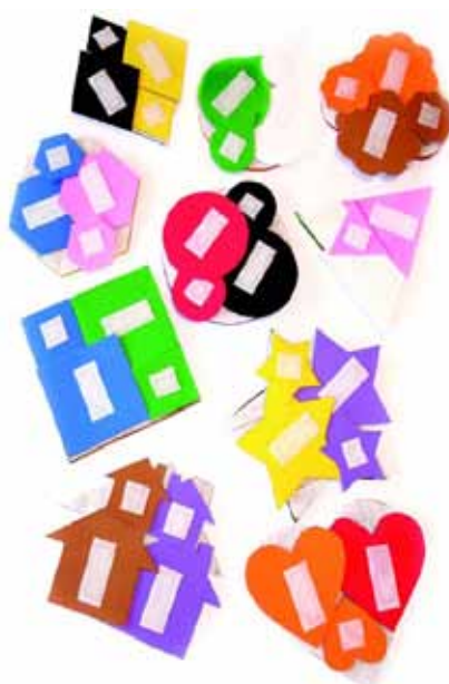
Figura 2: Peças do jogo.

Nomeado de “Pegue os Pares”, o jogo possibilita o aprendizado das formas, proporções, cores, texturas, quantidades, semelhanças, diferenças e significados. O objetivo principal é identificar os pares semelhantes pelo formato e pela cor. O jogo possui 40 peças de diferentes tamanhos, cores e formatos (Figura 2), 10 bases de diferentes formas e duas luvas especiais reguláveis (Figura 3). As luvas não exigem que a palma da mão fique totalmente estendida, pois o velcro faz o trabalho de fixar bem as peças. Se a mão da criança com deficiência for bastante retraída, a luva pode ser colocada no pulso, sobre a mão, nos pés.