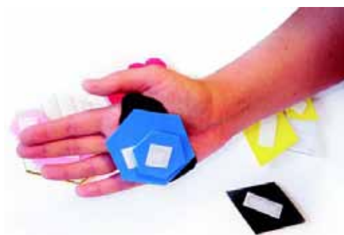
Figura 9: Duas peças na luva especial.

A principal regra do jogo é pegar as peças que formam pares (uma peça grande e uma peça pequena) através da forma e da cor igual, identificando as diferenças de proporções. A criança pegará a peça com a luva especial, ajustada em sua mão, através do encaixe do velcro. O mediador auxiliará a criança na retirada da peça e perguntará a ela em qual base deverá ser colocada a peça, fazendo a associação das formas. De acordo com a instrução da criança, o mediador colocará a peça na base indicada. Logo após, a criança deverá pegar a peça par correspondente, de mesma forma e cor, mas com tamanho diferente, que também deverá ser colocada na base com auxílio do mediador. As duas peças também podem ser pegadas juntas, conforme indicado na Figura 9. Com a dinâmica do jogo, a criança poderá assimilar as semelhanças e diferenças entre as peças, suas proporções, cores, significados e quantidades.