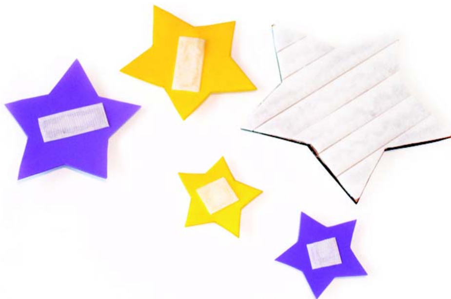
Figura 5: Peças de tamanhos e cores diferentes e base com velcro.

As bases possuem uma camada de E.V.A., outra camada de papelão que fornece a resistência necessária, e uma última camada de velcro, com o lado das voltas (Figuras 6 e 7). As peças são de E.V.A. e possuem aplicação de velcro, com o lado dos ganchos, em cada uma das faces.